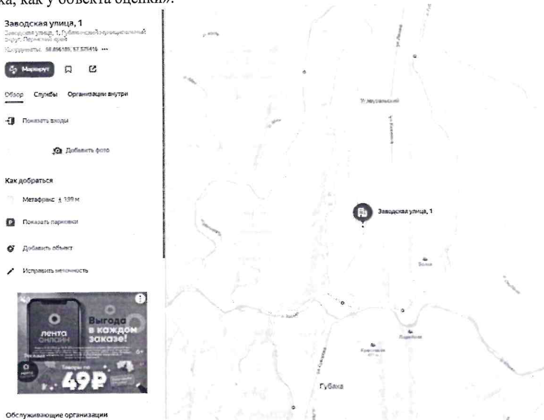
Рисунок 3 Запрос адреса объекта, расположенного на невыделенной территории на Яндекс карте

При этом обращаю Ваше внимание, что выделенная ниже на рисунке 3 зона непосредственно между городом Губаха и пгт. Углеуральский отмечается как Губахинский муниципальный округ, Заводская, 1, и данный адрес не отображается на карте как город Губаха, как у объекта оценки».